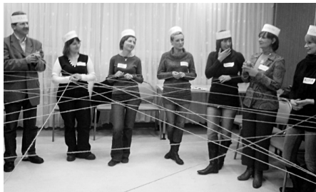
Symboliczne tworzenie sieci współpracy.

W połowie lutego br. ruszył cykl 6 bloków szkoleniowo-warsztatowych, doskonalący kompetencje pracowników ośrodków pomocy społecznej w zakresie animowania rozwoju lokalnego, w tym krzewienia postaw samopomocowych, rozwijania aktywności wolontarystycznej, tworzenia środowiskowych programów pomocowych, budowania lokalnych koalicji, pozyskiwania środków na projekty społeczne.