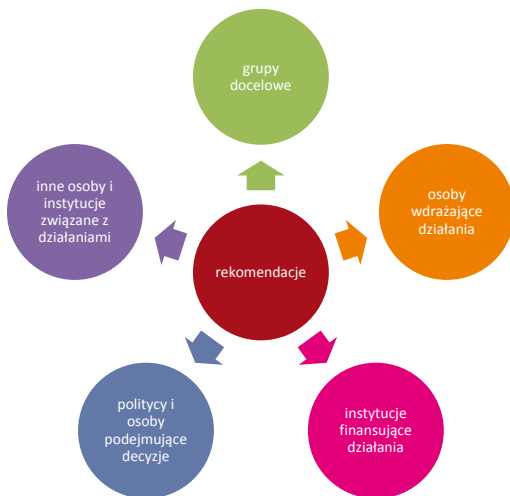
RYSUNEK 3. ODBIORCY REKOMENDACJI Z EWALUACJI

Powyższy schemat przedstawia podstawowe grupy, którym powinniśmy przedstawić wnioski i rekomendacje z ewaluacji. W zależności od przyjętego celu ewaluacji, przedstawiamy je grupom i osobom, które są lub powinny być zainteresowane działaniami realizowanymi w ramach projektu lub strategii.