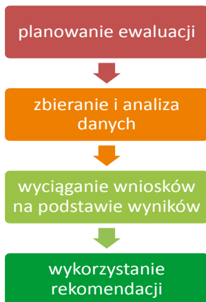
RYSUNEK 1. ETAPY PROCESU EWALUACJI

Każdy z etapów musi następować jeden po drugim i nie można opuścić żadnego z nich, aby ewaluacja była rzetelnie przeprowadzona. Każdy etap jest tak samo trudny. Jednak nie każdy etap musimy przeprowadzać we własnym zakresie. Przy ewaluacji zewnętrznej możemy doprowadzić do tego, aby zlecić zewnętrznemu ewaluatorowi zebranie i analizę danych oraz opracowanie raportu. Przy ewaluacji wewnętrznej i autoewaluacji wszystkie etapy przeprowadzamy we własnym zakresie. Niezależnie od tego jaki rodzaj ewaluacji wybierzemy, jesteśmy zobowiązani do zaplanowania i wykorzystania wyników ewaluacji.